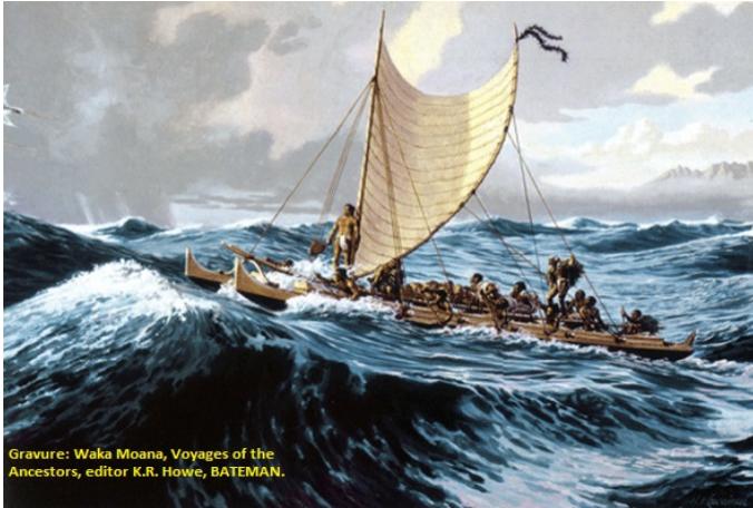
Gravure: Waka Moana, Voyages of the Ancestors, editor K.R. Howe, BATEMAN.