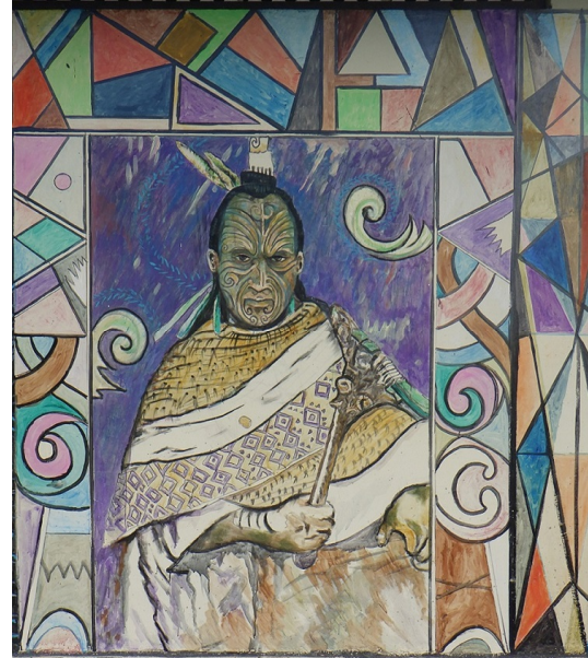
Fresque murale Chef Marquisien